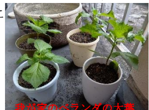
我が家のペランダの大葉

ものように5時15分のバスで空港にきた。早すぎた判断能力が劣化。羽村幼稚園の先生に日頃の働きに感謝し、御座候の大判焼きを買って行く。外部監査報告、内部監査を受ける。これからも子どもが楽しく、明るく、元気に憩える園を作っていこうと決意。金）東京、残務整理。今は空港からメール発信。明日は日善幼稚園の運動会。準備の職員に感謝。